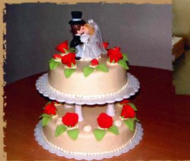
16. Mehrstöckige Torte mit Überzug, Rosen mit Blättern und Brautpaar 2- stöckig 3- stöckig 4 stöckig