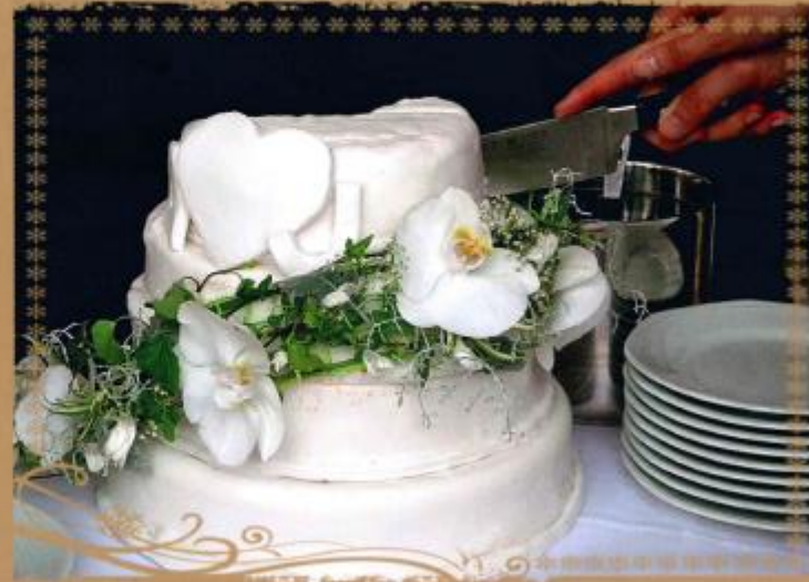
22. 3- stöckige Torte mit weißem Zuckerüberzug und Orchideen