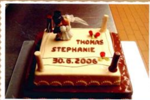
9. Zweistöckige Aufsatztorte als Boxring mit Überzug, Brautpaar und Schriftzug.