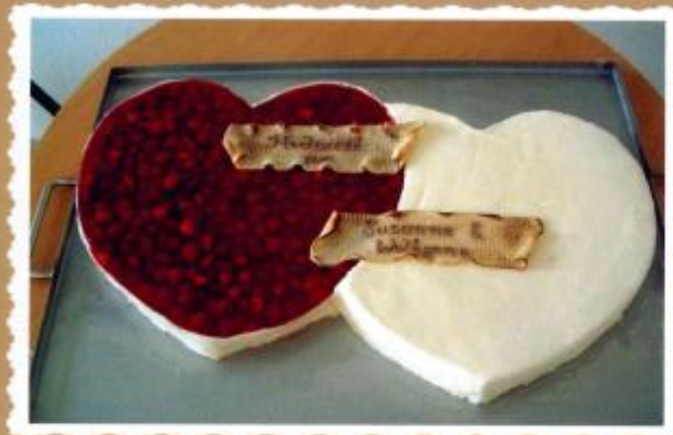
8. Doppelherz eine Seite mit frischen Erdbeeren belegt, andere Seite als Sahne- oder Butterkremtorte mit Zuckerüberzug, abgeflämtes Marzipanschriftband 80x60