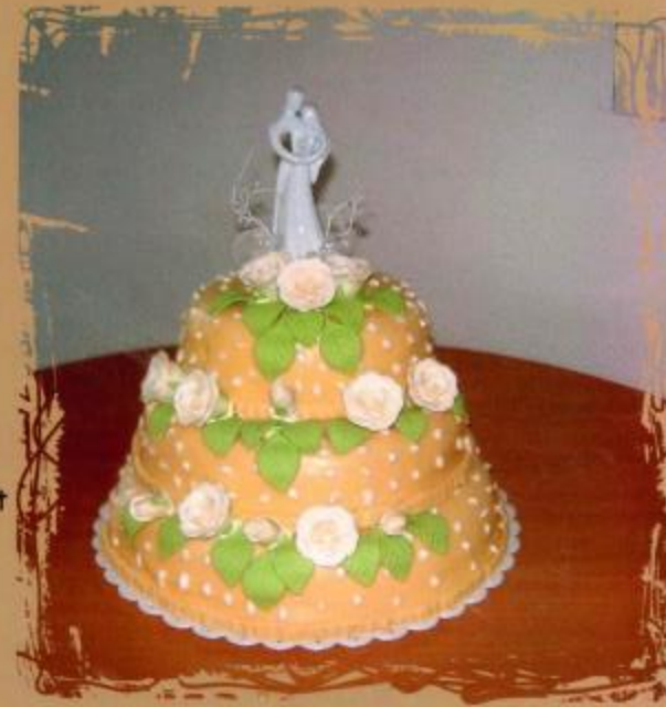
12. Aufsatztorte mit Überzug, Rosen mit Blättern und Brautpaar 2- stöckig 3- stöckig