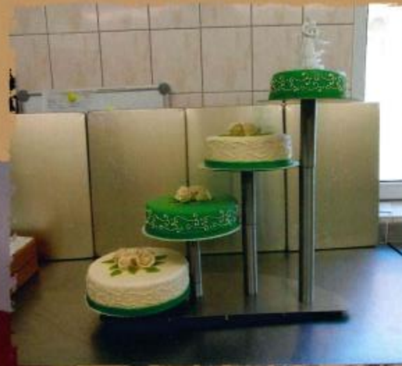
17. Mehrstöckige Torte mit eingefärbtem Zuckerüberzug, eingefärbter Zuckerüberzug als Rand, Rosen mit Blättern und Brautpaar