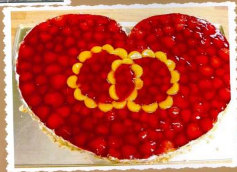
7. Erdbeerherz mit frischen Erdbeeren belegt, mit Mandarinen als Ringe und Mandelrand 60x40 80x60