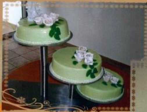
19. Torte mit Zuckerüberzug weißen Rosen als rankendes Bouquet und Brautpaar 3- stöckig