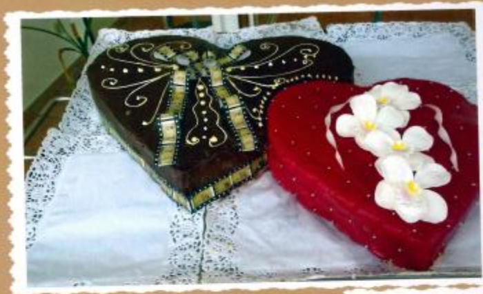
6. Doppelherz mit Zuckerüberzug, Dia Film als Fotodruck und Zucker Orchideen 80x60