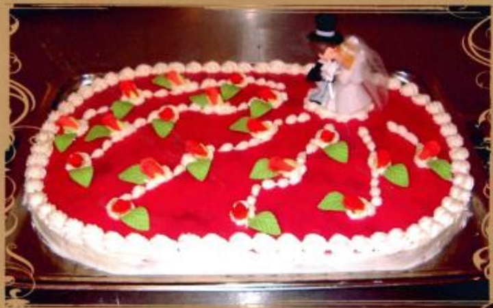
28. Rechteckige Torte mit Geleespiegel, Rosen und Brautpaar 30x40 60x40