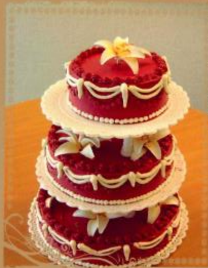
18. Sahne- oder Butterkremtorte mit Lilien 3- stöckig