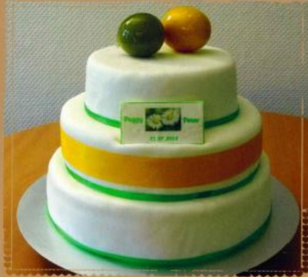
11. Aufsatztorte mit Überzug, farbiges Schleifenband und Fotodruck 2- stöckig 3- stöckig