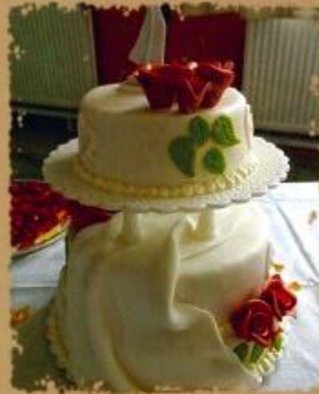
21. Zweistöckige Torte mit kleinen Rosenbouquets und Schleier