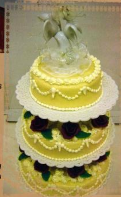
20. Mehrstöckige Torte mit Überzug Rosen mit Blättern und Brautpaar